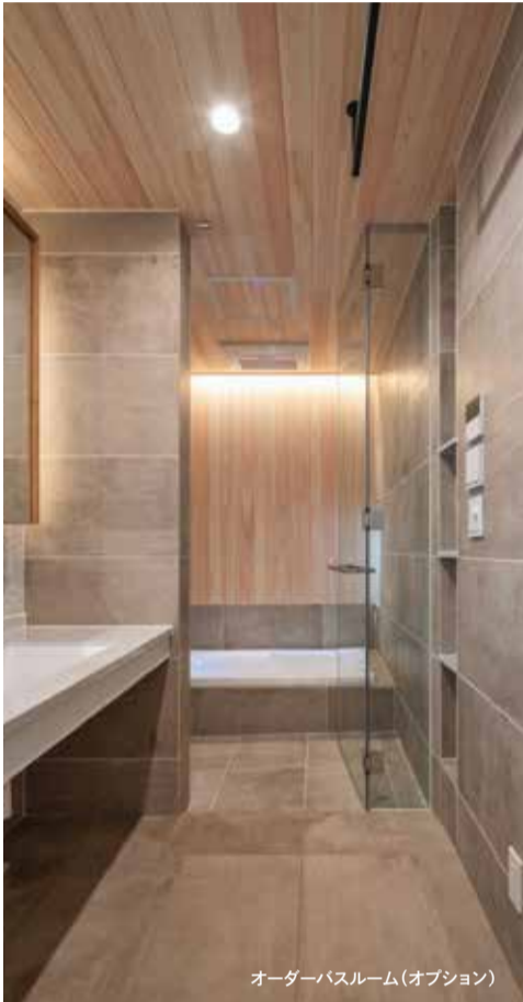
オーダーバスルーム(オプション)