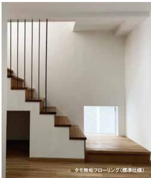
タモ無垢フローリング(標準仕様)